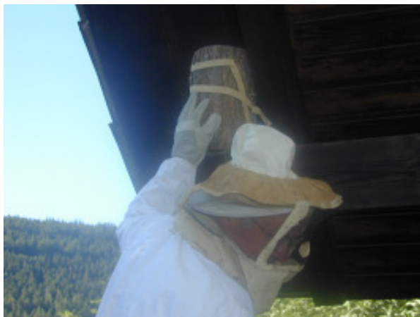
Das Nest wird abgenommen (hier im Nistkasten)