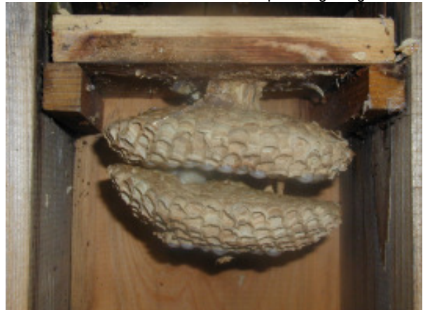
... und in einen Hornissenkasten eingebaut.