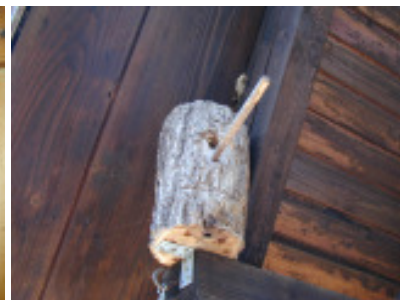
...und in einem Vogelnistkasten