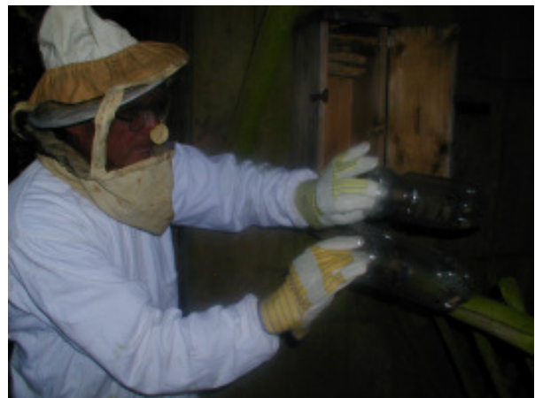
...die restlichen Hornissen zum Transport eingefangen