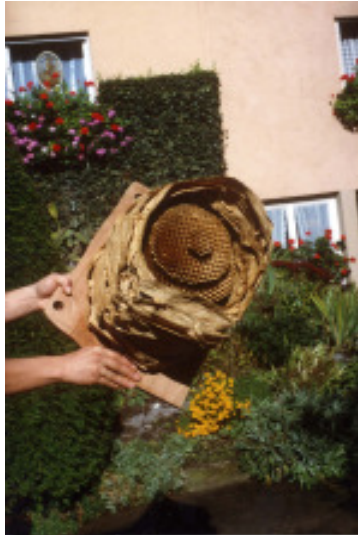
Leeres Hornissennest vom Vorjahr