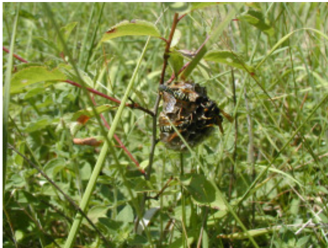
Das kleine Nest einer Feldwespe .

Nur diese zwei „lästigen“ Wespenarten interessieren sich für unsere Getränke und Süßspeisen. Sie bilden Völker mit 1000 - 5000 Tieren . Auf dem Höhepunkt der Volksentwicklung sind nicht immer alle Arbeiterinnen damit beschäftigt, die Brut zu versorgen. Diese Tiere sind es dann, die sich über die Kaffeetafel hermachen. Deshalb fangen die „ Wespenprobleme “ auch erst Ende Juli oder August an. Offen hängende „Papiernester“ auf dem Balkon gehören nie zu den beiden Arten von „Plagegeistern“. Dem schlechten Ruf der Wespen fallen aber leider oft diese friedlichen Arten (z.B. Sächsische Wespe) zum Opfer, weil ihre Nester gut sichtbar sind. Also: Alle frei nistenden Arten werden nicht lästig , schon weil die Zahl der Insekten in den Völkern klein bleibt (200-300 Tiere). Sie sollten unbedingt geschont werden. Was viele nicht wissen: Diese Wespen sind Insektenjäger . Die Larven werden ausschließlich mit erbeuteten, proteinreichen Insekten versorgt. Ein großes Wespenvolk verfüttert täglich so viele Insekten, wie eine ganze Meisenfamilie benötigt. Pro Tag fangen Hornissen für ihre Larven bis zu einem Pfund Insekten, darunter auch viele Schädlinge. Sie erfüllen damit eine wichtige ökologische Funktion , die mit zur Ausgewogenheit unseres Naturhaushalts beiträgt.