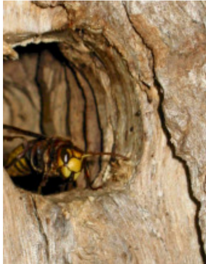
Hornisse am Einflugloch einer Baumhöhle