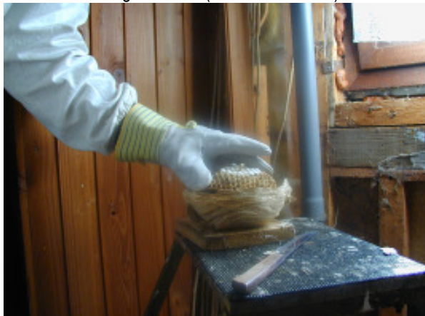
...das Nest (mit Heißkleber) wieder zusammengesetzt